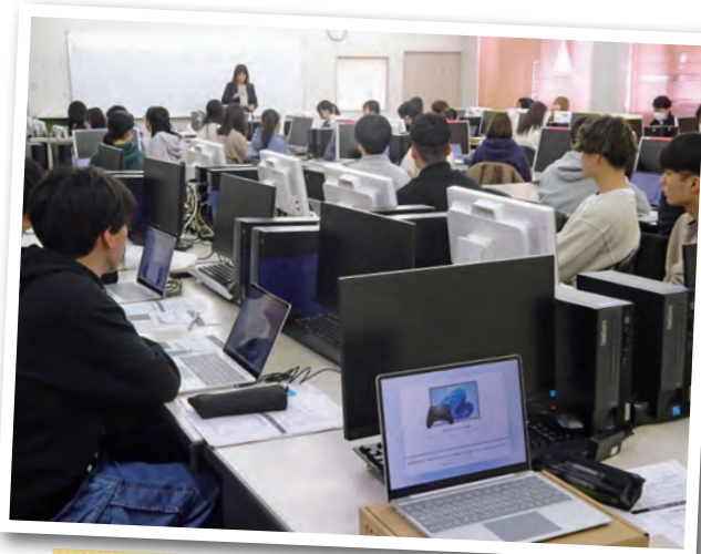
セットアップ講習会の様子（2025年4月）

大学では授業での課題・レポートの作成やサークル活動など、様々な場面で使うので、普段から持ち運べるPCがあると便利。万が一故障やトラブルがあってもすぐに生協のお店に対応してもらえるので安心です。PCを受け取る際に無料のセットアップ講習もあるので、大学から付与されたOffice365の設定もスムーズにできました。自分での設定は大変だと感じる方々には生協推奨パソコンの購入をオススメします！