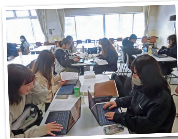
パソコンを使用し学食で課題に取り組んでいます