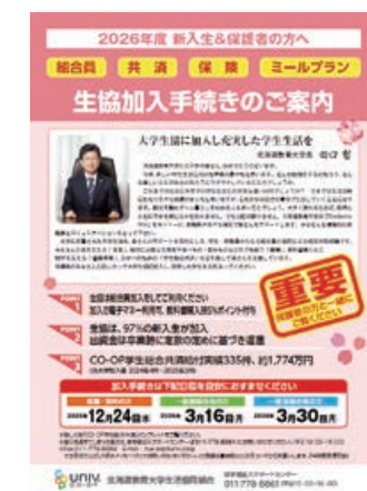
▲加入手続きのご案内