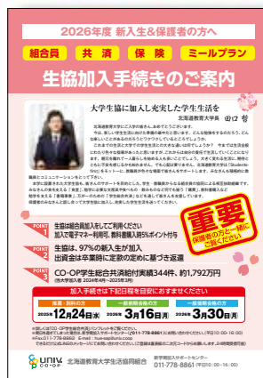
▲加入手続きのご案内