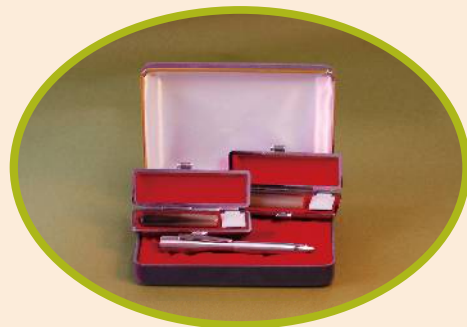
※白の見返しに「卒業記念」等の文字が入ります。 詳細は裏面をご覧ください。