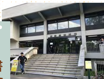
共済・組合員センター (クラーク会館2F)