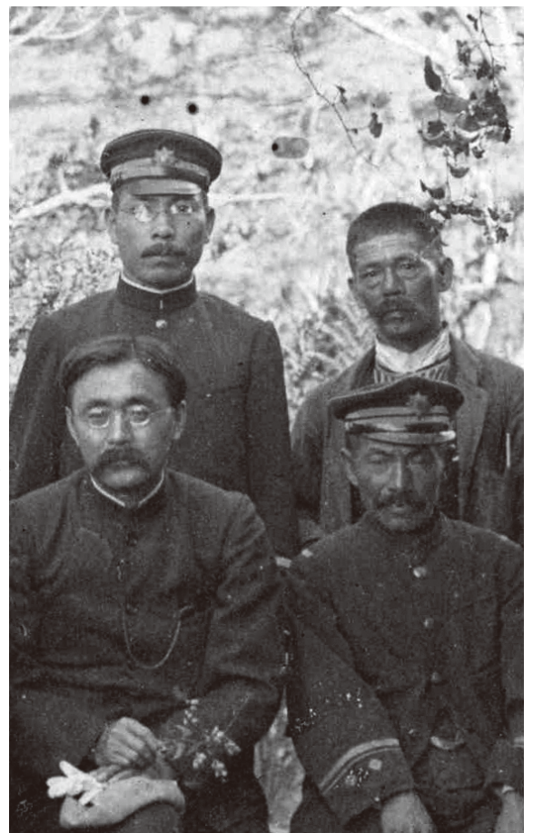
(台湾統治状況視察の新渡戸稲造、高岡熊雄ら一行・北海道大学文学書館所蔵)

新渡戸：それはすばらしい。嬌艶（きょうえん）で愛らしいこの花を東京の自宅の庭にも咲かせたいので、花から種を採ります。