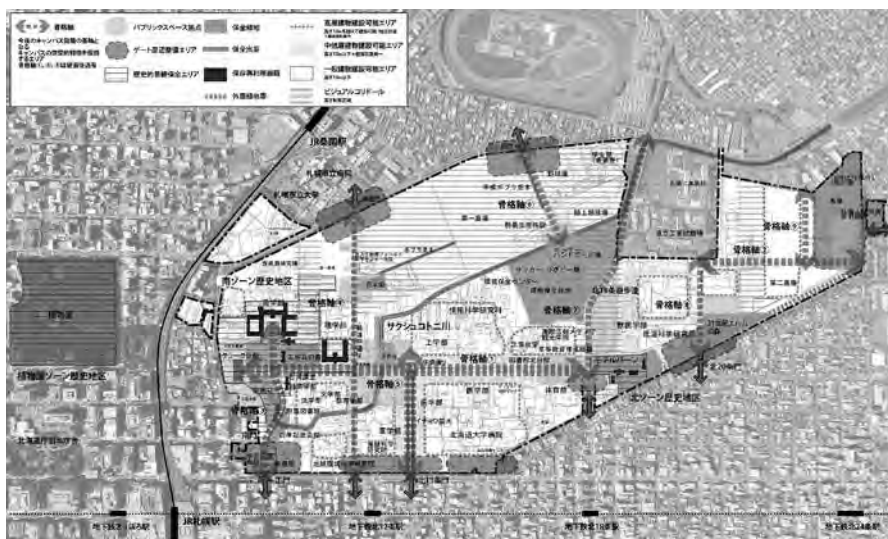
キャンパスマスタープラン2018

交差点がつくられています。北13条道路の両側には南側に医学部の建物群、北側には附属病院の建物群が建設されているのがわかります。まさに、この時期を起点としてキャンパスは東西から南北へ発展していったのです。同時に北13条道路も重要な東西軸としてキャンパス中央部の骨格に位置付けられました。北13条周