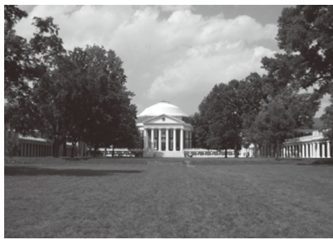
バージニア大学のザ・ローン

建築が配置されるといえるのは、極めて稀な配置計画だったのです。このようなキャンパス計画が生まれた背景には、札幌農学校の設立当時の組織構成と関係があると考えられます。札幌農学校の創設期には、アメリカから来た多くの教授陣が教鞭をとり、欧米の最新情報が教えられていました。彼らが理想的なキャンパスをつくるために、自国の最先端のキャンパス計画をその範としたという可能性は十分にあります。