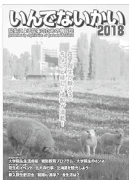
※写真は2018年度版です。

る「いんでないかい2019」を今年も発行します。先輩院生からのアドバイスや院生生活、北海道観光まで幅広く掲載します。2月中に完成3月に資料請求いただいた方に送付する予定です。