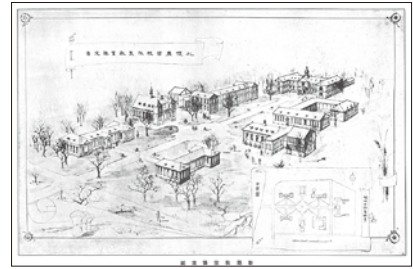
札幌農学校改築教室予定図

北海道大学には、キャンパスマスタープランがあります。将来に向けての主要なキャンパス環境の維持保全、建築物の配置やデザインなどの方針を定める重要な計画です。本学は全国の国立大学に先駆けて1996年にキャンパスマスタープランを策定し、2006年、2018年に改訂している、現在のものは3代目ということになりました。その間一貫して重視していたのが、フレームワークプランというキャンパスの空間構成に関するものです。キャンパスの真ん中を南北に貫く中央道路に沿って大学が発展して来たのは、大学の発展の歴史をたどるとすぐにわかるし、歴代のキャンパスマス