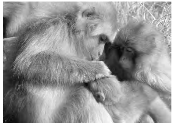
毛づくろい中の親子。母ザルの手元に何かを見つけたらしく、毛づくろいしてもらおう順番を待っている子ザルが「あった!」と身を乗り出しています。うっかり手を出すと母ザルに怒られます。

皮のお手入れと言えば毛づくろいです。蚤取りとも言われますね。動物園で見たことのある人もいると思いますが、毛づくろい中のサルは、毛をかき分けて何かを探しては時々指でつまんで口に放り込み、もぐもぐとやっています。あれは何を探しているのかご存知ですか？サルがつまみ上げたものを取り上げて確かめた研究によると、ノミではなくシラミの卵を探して取り除いているのだそうです。シラミのほかにはマダニも毛づくろいで取り除くけれども、口には入れないそうです。マダニは味が悪いのだからなどと言われていますが、シラミの卵をプチッと噛み潰すのは案外楽しかったりして。この研究では数ヶ月の間、毛づくろい中のサルの手元に親指に両面テープを貼った自分の手を置いてスタンバイし続け、ようやく7個のシラミの卵を押し取っています。これを