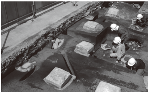
写真1: 溝状遺構(黒味を帯びた覆土から把握された。コンクリート基礎や円礫は後代のもの)

「北海道式古墳」とは、8〜9世紀頃に、主に石狩低地帯北部(札幌・江別・恵庭地域)で構築されていた墳丘墓です。多くの場合、幅が約1m、深さが約0.5m程度の溝が、直径5〜6mほどの規模で円環状に掘削され、溝で区画された内部にその掘削土が盛りられて、墳丘を伴った墓が構築されて