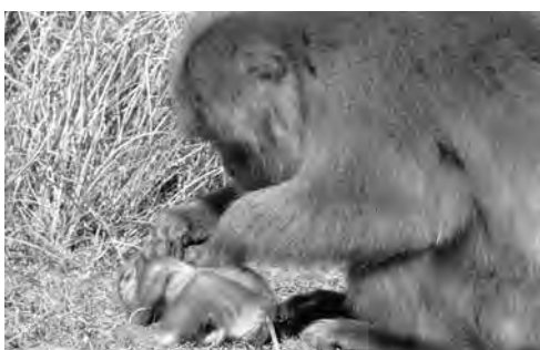
そうと、そうと。群れで一番強いオトナのオスがアカンボウを毛づくろい。とても優しい手つきです。

毛づくろい中は自分自身でするだけでなく、群れの仲間どうしでもやりあいます。仲間 させてくれたのは、餌付けをして人間によく慣れた群れのサルの中でも、触れるのを奇跡的に許してくれた特別な2頭だったそうです。わたしならプチッとやるクライマックスの直前に卵を横取りされたらイラッとしてしまいそうですが、2頭は淡々と毛づくろいを続けていたそうです。それにしても、数ヶ月間も毛づくろいの間じゅう、自分の手元に人間の手が置かれ続けた心持ちやいかに…？