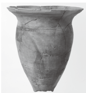
写真2: 溝状遺構から出土した擦文土器