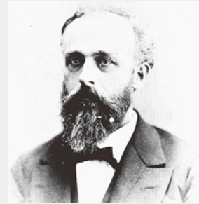
エドワード・モース

世紀頃というのは、擦文文化の大規模な集落が残されるようになった時期です。「北海道式古墳」は、擦文文化を担っていた人々の墓として、当時の社会の実態に迫る重要な手がかりを与えてくれるものです。