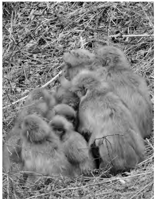
サル団子。コンパクトに見えるけど、10頭以上のお団子です。

ワザを獲得しました。でも、 この汗、ベタつきや臭いの元 になって、時に厄介ですよ。 わたしたちが制汗剤や香水、 衣類の洗剤や柔軟剤と臭いに 一生懸命気を配っていること を思うと、ほとんど汗をかか ないからとは言え、自然に心 地よい匂いを醸成できるなん てちょっと羨ましいような気 もします。