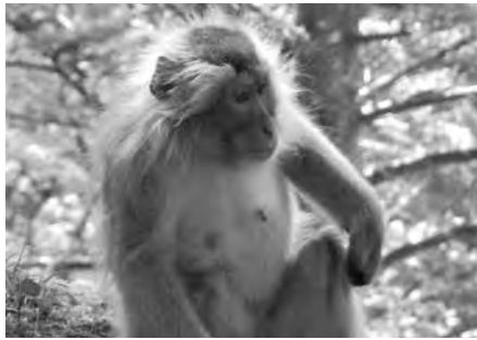
あるオトナのメスの毛変わり。毛変わり前のぼさぼさの冬毛(左)と毛変わり途中(右)。頭のてっぺんにお血…。夏までもう一息。