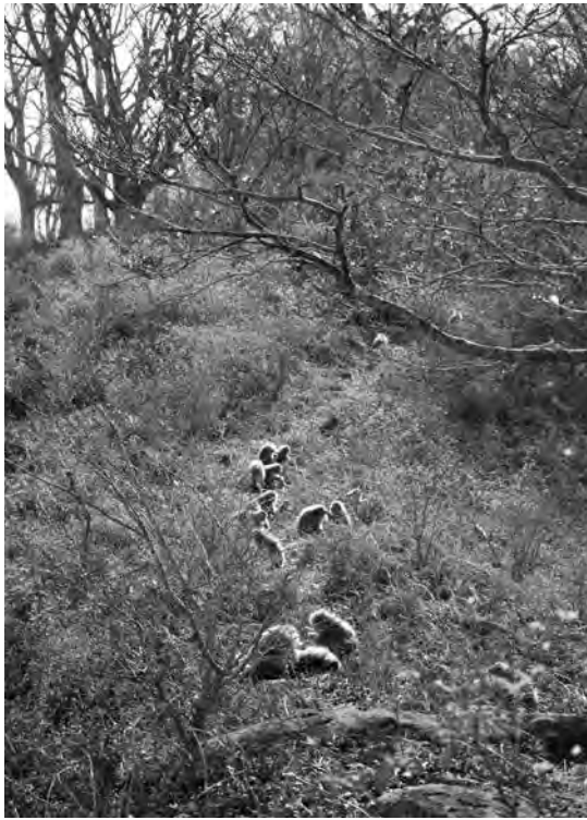
ある朝の風景。群れじゅうのサルがお互いに毛づくろい。

アカンボウを連れていないけれど冬毛のままのオトナのメスがいれば、彼女は出産を控えている可能性が高いです。逆に、お腹が大きいから出産するかもしれないと期待していると、仲間が遅れずしっかりと毛変わりが始まって、食べすぎたのかお腹がふくれていただけだったなんてことも。 夏毛から冬毛への毛変わりはちよっとわかりにくく、いつの間にか冬毛になっていきます。ふわふわの冬毛はとても暖かそうです。真冬でも晴れてちよっと気温が上がる日には、雪にお腹をくっつけて寛ぐ姿が見られます。ダウン