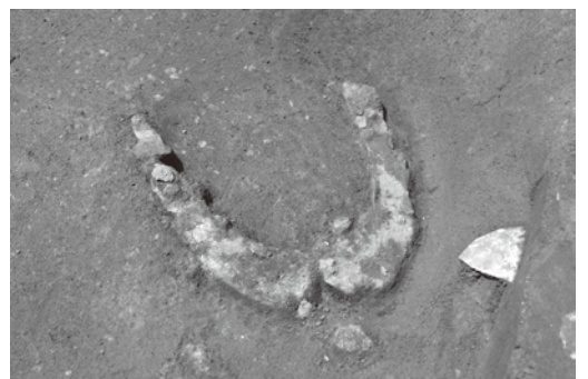
写真3: 鉄製鋤鋤先の出土状況

我々はその二つを掘り、地面のもとの水準に迄達したが、陶器は一つも見出せず、骨の破片が僅かあった丈である」という記録を残しています。