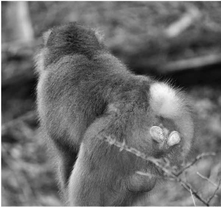
筋骨隆々、やる気満々のオス。カラーでお見せできないのが残念ですが、立派な陰囊は鮮やかな赤色で目を引きま

突然ですが、日本の法律で認められた配偶の形は一夫一妻です。でも、歴史をひも解けば、一部の人々の間では一夫多妻が普通だった時代もあるし、世界には一夫多妻の認められている国もあります。恋愛にいたっては一妻多夫の例も見聞きますね。わたしたちヒトの生物として自然な配偶の形はどれなのでしょう。一説によると、わたしたちの自然な配偶の形は、やはり一夫一妻なのだそうです。進化の過程で一夫一妻制を獲得すると同時に、わたしたちは