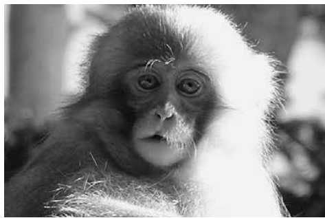
恋の騒動のとはっちりを受けた子ザル。よく見ると唇が食いちぎられた跡が残っています。

発情メスが多すぎてあぶれ てしまうことも、たまにはあ ります。そんな時は、なんと、 男性の研究者たちはあぶれた メスにお尻を向けられじりじ りと近寄ってこられる経験を しているそうなんです！つま り、サルのメスに交尾に誘わ れたわけです。わたしも、メ スがあぶれてしまっている状 況には何度か出くわしたこと がありますが、そんな経験は ありません。反対に、オスに メンチ切りで迫られたこと があります。同じ群れを調査 していた男性研究者に聞くと、 そんな扱いを受けたことは一