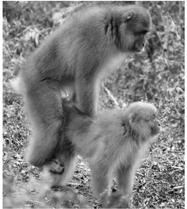
交尾のポーズにはあうんの呼吸が大切です。タイミングが合わない時は仕切り直します。

があぶれてしまうことになり ますが、比較的平和です。強 いオスたちがメスを独占し て、それ以外のオスたちはあ きらめてしまうのか、あまり 存在感がありません。発情メ スが多い時は、群れの中はそ れはもうシツチャカメツチャ 力です。あちらこちらにやる 気満々のオスがいて、木をゆ すったり「ガガガガ」と吠 えたりして自分の存在をア ピールします。それを見たメ スたちはあっちのオス、こっ ちのオスと忙しく動き回りま す。元のオスに気づかれない