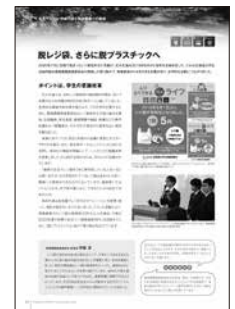
『北海道大学サステナビリティレポート2020』9ページ

本号では、サステナビリティレポートで書けなかったこの取り組みのコロナ禍にある現状や省令改正施行によるレジ袋有料化の影響、更にはそこから発生する課題等を皆様に提示します。