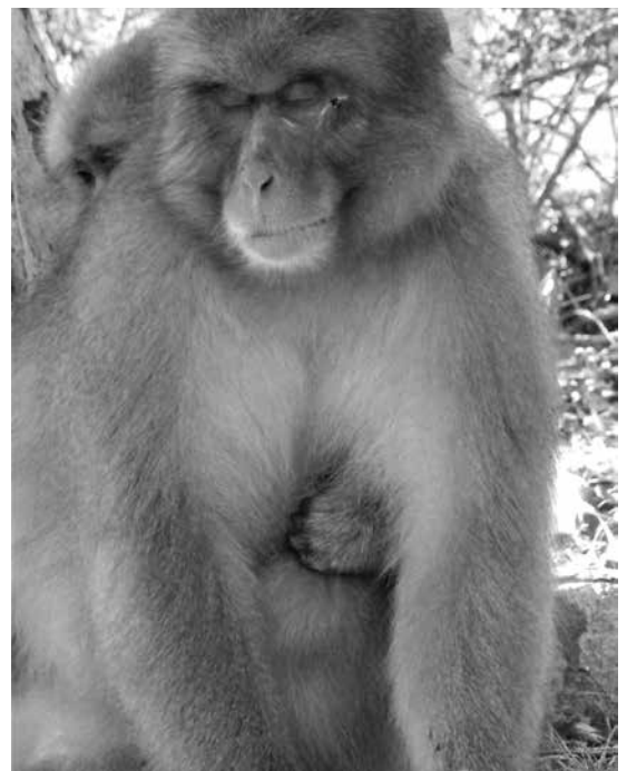
抱きしめられるオス。後ろのメスは「大好き…」とささやいている？移り気なメスたちですが、発情の間じゅう1頭のオスに一途なこともあるんです。

度もないそうです。このメン チ切り、迫力があってけっ こう怖いもので、ついほかの メスたちと一緒にあってそろ りそろりと彼の視界から逃げ てしまいます。とは言え、な んだか同じ土俵に上げられて しまったようで、とても複雑 な気持ちになりました。どう も、サルたちは私たち観察者 の性別を見分けているようで す。それにしても、異種の異 性であるわたしたちは、その 時のサルにどんなふうに映っ ていたのでしょうか。