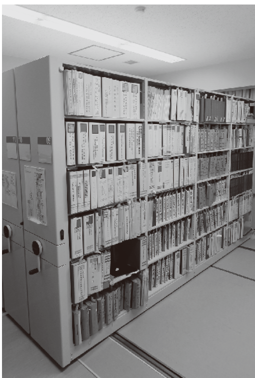
青ファイルの文書資料も並ぶ収蔵庫の書架

こうした文書資料は、大学の歴史の骨格部分を記録しています。しかし、それだけでは150年の歴史を紡げません。皮膚・筋肉部分となる「別の資料」については、また次回に。