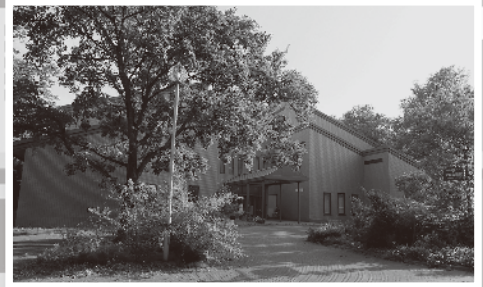
大学文書館の建物外観（クラーク会館の西隣り）

イブズ(archives)とは、様々な媒体により保存された記録そのもの、あるいは、そうした記録を集積・保管する場所を示す用語です。大学アーカイブズは、個々の大学の中で、大学の歴史や歴史的な資料を仕事の中心に据えている機関と言えます。