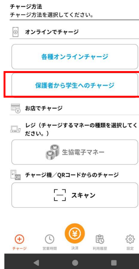
②「保護者から学生へのチャージ」をタップ