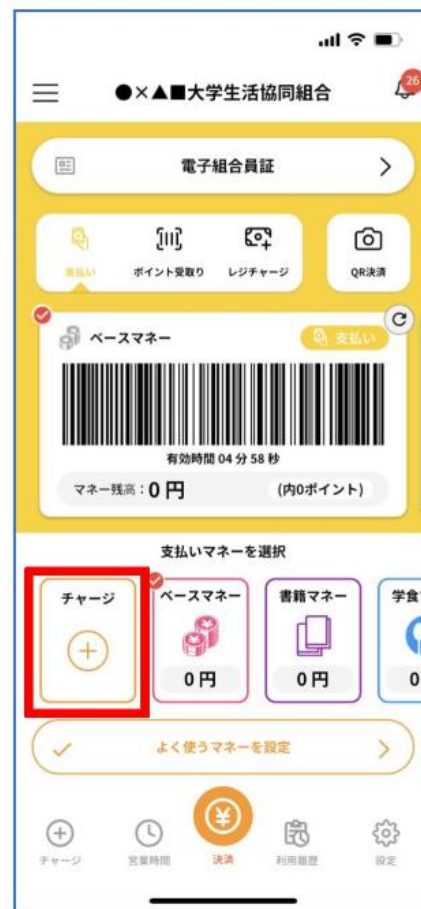
①まずは「チャージ」をタップ

大学生協アプリは、学生本人がご自身のスマートフォン、ご自身のメールアドレスでご登録いただくことでLica（電子マネー）やミールプランの利用ができます。保護者様も「大学生協アプリ」にご登録いただく事で、お子様の利用履歴を確認したり、お子様のLica（電子マネー）にチャージができます。