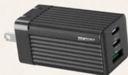
高速充電器 SuperPort S3