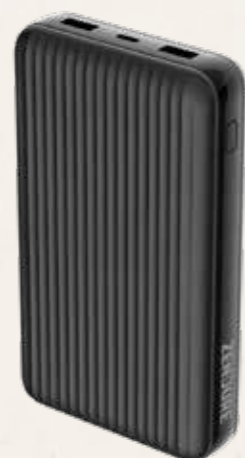
モバイルバッテリー SuperTank S4