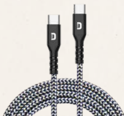
充電ケーブル SuperCord 100W Cable