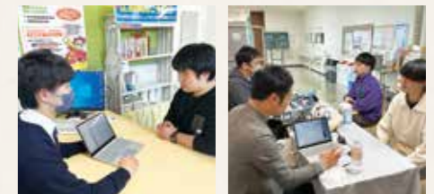
パソコンのお困り事は生協で解決できます メーカーが毎年、パソコン点検を実施します

故障、トラブルはもちろん、操作方法がわからない等でも、 学内にある生協店舗に相談 でき、講義の空き時間など、気軽に立ち寄れます。また、毎年メーカーの技術者にぎてもらい、 無料点検会も実施 しています。