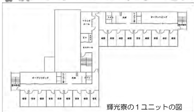
輝光寮の1ユニットの図