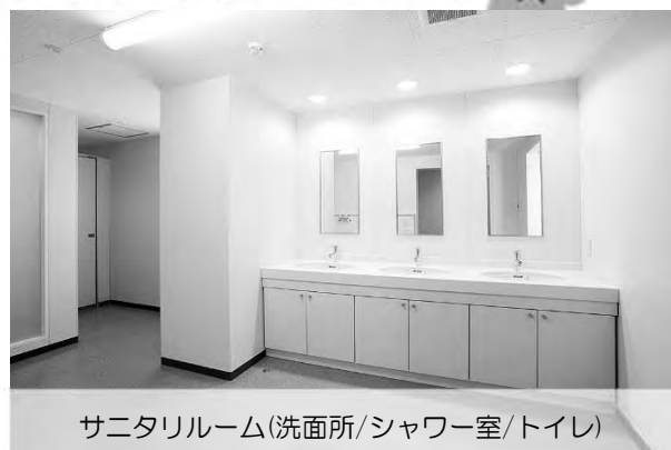
サニタリルーム(洗面所/シャワー室/トイレ)