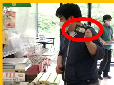
現金のやり取りを少なくするため、学生証ICカードでのお支払いをお願いしています。