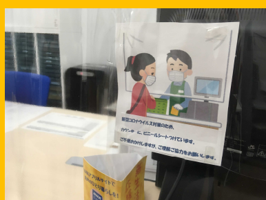
購買・書籍・旅行・ルームガイド店のカウンターにもビニールシートを設置しています。