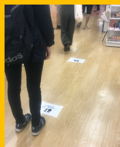
レジ待ちは距離をとって並びます。