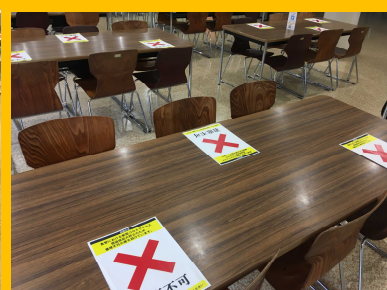
食堂ホールの座席は隣と正面は着席禁止。距離をとって着席をお願いしています。

人が触れる部分（レジ台・食堂出食口・飲料ケース扉やその他触れることが多い箇所）は定期的に消毒を行っています。また入口や窓の開放などで換気を行っています。