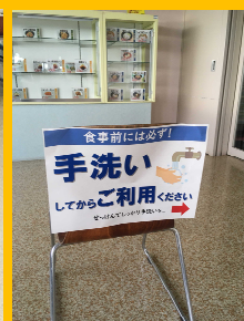
ご利用前に手洗いをお願いしています。