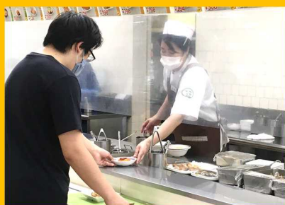
食堂出食口、レジに感染防止用ビニールシートを設置しています。