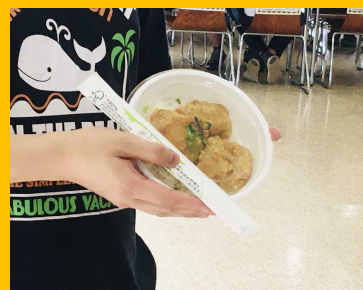
丼・カレーはテイクアウトできるので、混んでいるときは外や教室で食べることも出来ます。