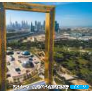
ドバイフレーム / ©ドバイ経済観光庁 イメージ