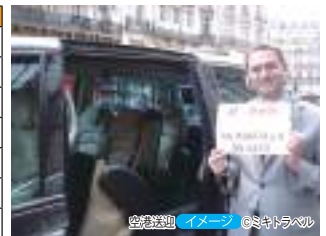
送迎専用車 イメージ

※運転手(英語またはその国の言語)のみで、日本語を話すアシスタントは付きません。※ホテルのチェックイン、チェックアウト、空港でのチェックイン等はお客様ご自身で行っていただきます。※上記以外の都市に関してはお問い合わせください。