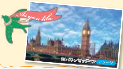
ロンドン/ビッグベンを イメージ