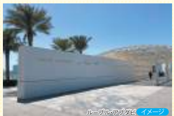
ルーブル・アブダビ イメージ