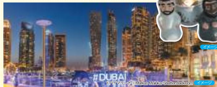
ドバイマリーナ / イメージ