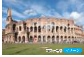
コロッセオ イメージ

古代からの歴史が息づく、永遠の都ローマ。かつての大帝国を彷彿とさせる遺跡が街中にあふれています。歩いて歩くから歩きやすい靴を忘れずに!! 魅力の尽きない古都をお楽しみください。