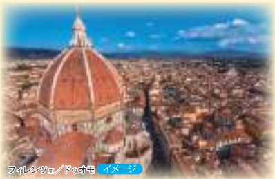
フィレンツェ/ドゥオモ イメージ

コース通りでもよし! 途中地延泊や最終地延泊を加えてもよし! あなたの旅と一緒に考え、お手伝いします! ※3パターン以上の場合には別途見積り手数料が必要です。(問い合わせ内容により異なります。)