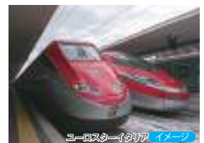
ユー・エス・エーイタリア イメージ

※希望時間帯より10~15分程度前後する場合があります。※ご予約の状況により、ご希望の時間帯でお取りできない場合がありますので予めご了承ください。※取消料金はツアー本体に準じます。P.18の「ご案内とご注意」の「各種追加プラン」をご参照ください。