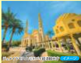
ジュメイラモスク イメージ