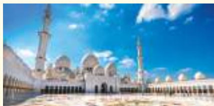
シェイク・ザイド・グランド・モスク/ イメージ