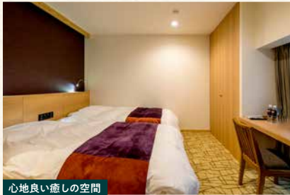
心地良い癒しの空間