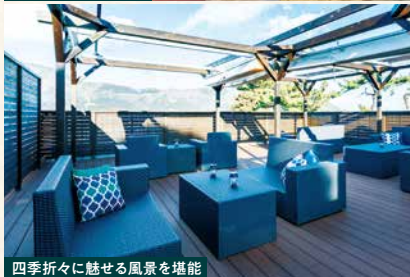
四季折々に魅せる風景を堪能