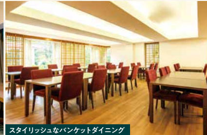
スタイリッシュなバンケットダイニング