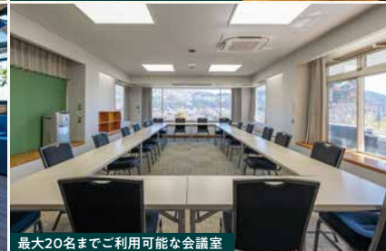
最大20名までご利用可能な会議室