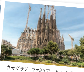
#サグラダ・ファミリア #スペイン