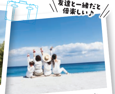
#ビーチ #一生の思い出