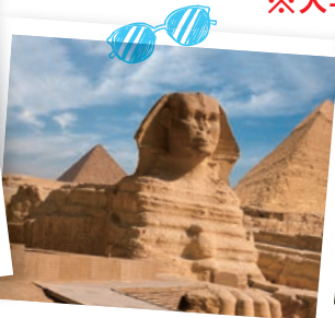
#スフィンクス #ピラミッド