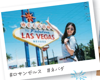
#ロサンゼルス #ネバダ