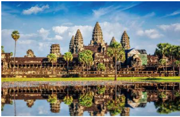
フリータイム時:アンコールワット(イメージ)