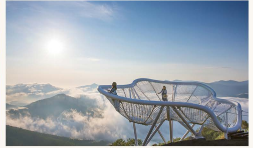
※写真はあくまでイメージとなります。