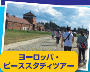
ヨーロッパ・ ピーススタディツアー