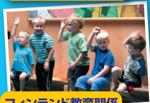
フィンランド教育関係 視察研修