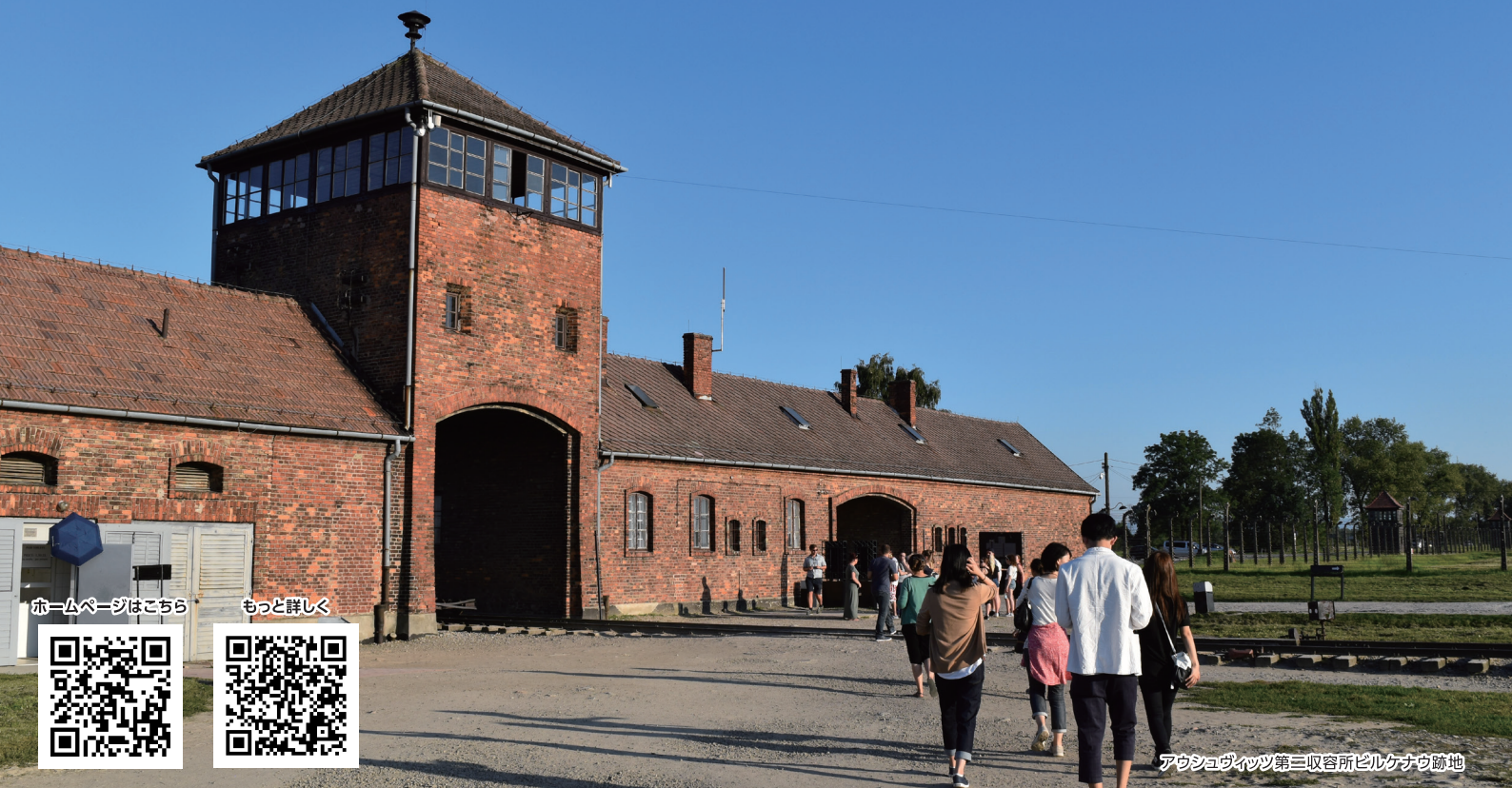
アウシュヴィッツ第三収容所ビルケナウ跡地