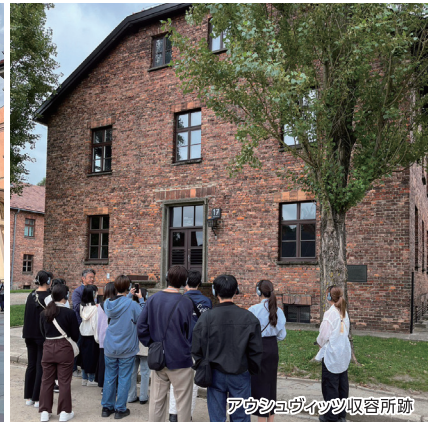
アウシュヴィッツ収容所跡

科学技術、医学、芸術、法律、信仰...すべてが間違った方向にねじまげられた悲劇の結果が、ここほど雄弁に平和の切実さを語りかけてくる場所はありません。この場所に立ってみると、きっと皆さんの価値観がゆさぶられることでしょう。“人間を知る”、“世界を知る”旅と一緒に出かけましょう!