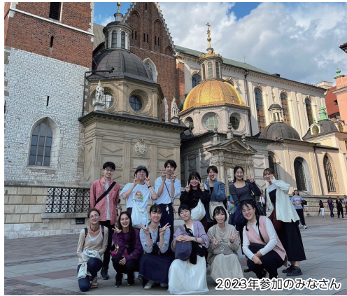
2023年参加のみなさん