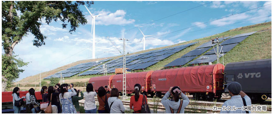
カールスルーエ風力発電

ドイツの「環境首都」として名高いフライブルクを中心に持続可能な地域社会について、エネルギー、交通政策、まちづくりといった視点から学びます。様々な視察先をドイツ在住の環境ジャーナリストの解説を受けながら共通の問題意識を持つ参加者(大学生)と巡ることで、単なる視察に終わらず日本を振り返り、視野を広げ、お互いの考えを深めることができるでしょう。