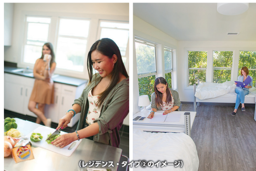
(レジデンス・タイプ②のイメージ)

(注1)レジデンスタイプ①は徒歩圏内の学生寮です。(注2)レジデンスタイプ②は学校キャンパス敷地内の学生寮で通学時間0分の立地です。