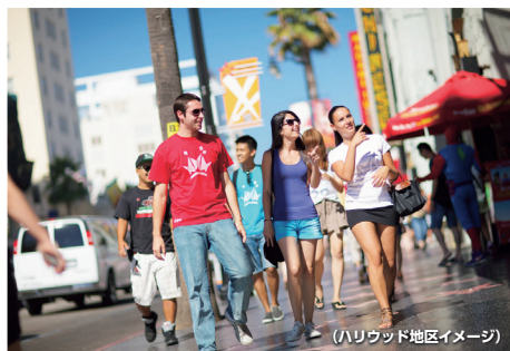
(ハリウッド地区イメージ)