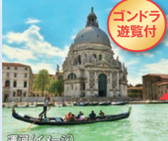
運河(イメージ) 水の都 世界遺産 ベネチア

世界遺産 ベネチア 現地で選べる滞在プラン ① 充実の市内観光 (日本語ガイド付) ●ドゥカレ宮殿、 ●サンマルコ広場、 ●サンマルコ寺院、 ●溜め息橋 ② 各自散策