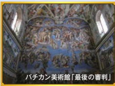
バチカン美術館「最後の審判」