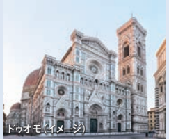
ドゥオモ(イメージ) 花の都 世界遺産 フィレンツェ

世界遺産 ベネチア 現地で選べる滞在プラン ① 充実の市内観光 (日本語ガイド付) ●ドゥカレ宮殿、 ●サンマルコ広場、 ●サンマルコ寺院、 ●溜め息橋 ② 各自散策