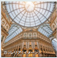
ガッレリア(イメージ) 流行と文化の街 ミラノ