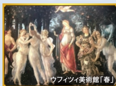
ウフィツィ美術館「春」

宿泊 ローマでは自由行動に 便利な市内中心部(※) スーペリアクラスホテル(当社 基準) にゆとりの2連泊 (※)テルミニ駅 から2km以内