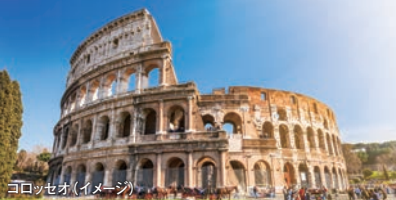
コロッセオ(イメージ) 世界遺産 ローマ& 世界遺産 バチカン市国