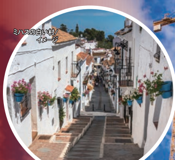
ミハスの白い村 イマージュ