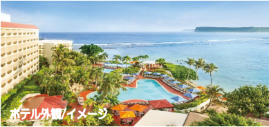
ホテル外観/イメージ

【プレミアタワーオーシャンビュー】5～13階 お部屋の広さ約35㎡(バルコニー除く) 2024年1月に客室リニューアル。 改装済みのお部屋がご利用いただけます!