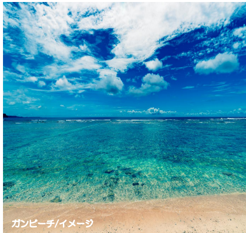
ガンビーチ/イメージ