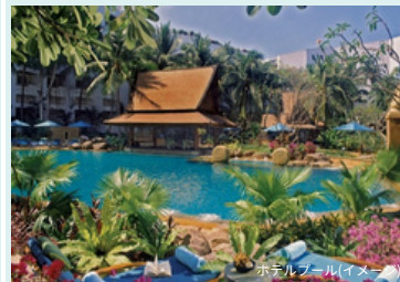
ホテルプール(イメージ)