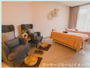
マッサージルーム(イメージ)

受賞歴もあるMASON自慢の、石を使用した「メイソンジラマッサージ」でリラックス ※別途追加料金がかかります。