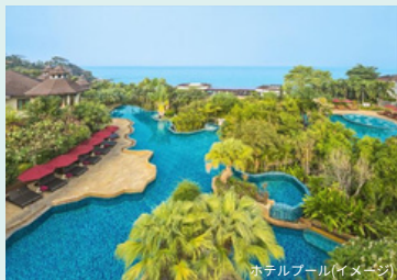
ホテルプール(イメージ)