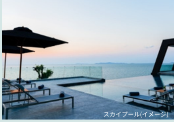
スカイプール(イメージ)