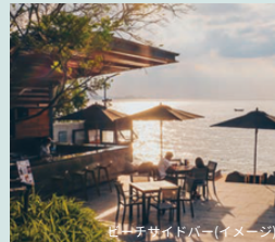
ビーチサイドバー(イメージ)