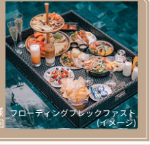
フローティングブレイクファスト(イメージ)