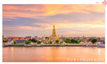
ワット・アルン(イメージ)