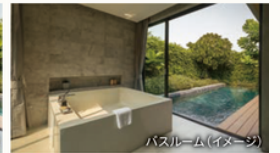
バスルーム(イメージ)